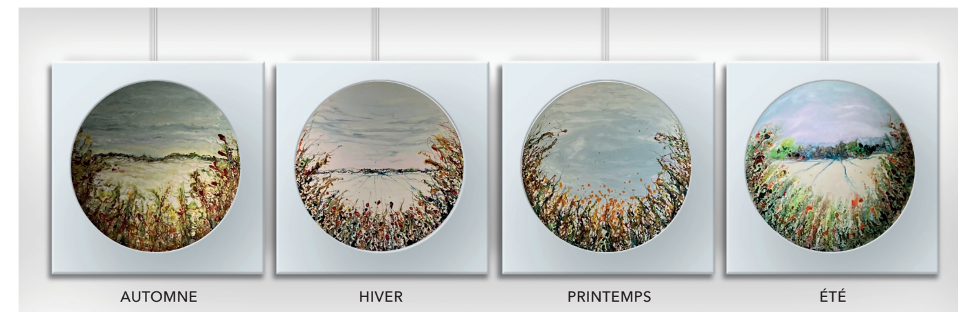
Les Quatre Saisons, 50 x 50 cm (x4)